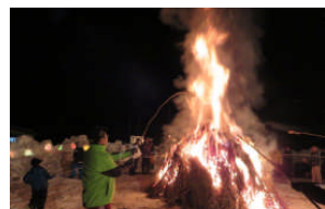
上町・後原地区の 歳の神