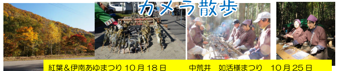
紅葉&伊南あゆまつり 10月18日 中荒井 如活様まつり 10月25日