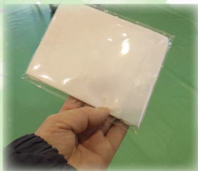
配布された1枚目のマスク