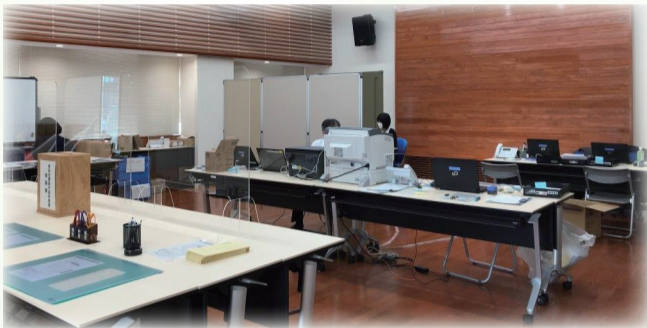
申請相談と手続き業務を行う