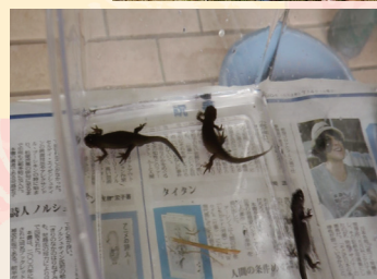
300匹以上のドジョウとイモリ！