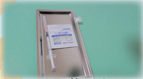
ファイザー社のワクチン

南会津町では「65歳以上の方の予約枠を十分に確保しておりますので「予約ができない」といった心配はありません。ご安心ください」と話しています。HPにも掲載しています。