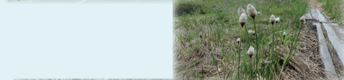
ワタスゲ 6月10日~25日頃、綿毛が大きくなり始める