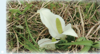
砲が二つ 双砲ミズバショウ