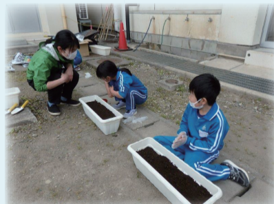
5粒づつ5箇所に蒔いた