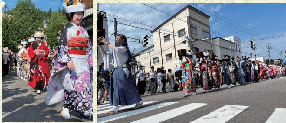
4年ぶりに七行器行列に女性が参加

23日朝、神社へお供え物を運ぶ七行器行列には4年ぶりに花嫁姿の女性が参加しました。行列にはおよそ30人の女性らが参加。友好都市であるさいたま市や台東区からも参加していました。神輿渡御や大屋台運行には、県内の陸上自衛隊(幹部)の皆さんが協力を申し出て参加しました。大屋台の上では子供たちの歌舞伎が上演されました。観光客からは「どこへ行っても歌舞伎を見ることができる。珍しい祭りだ」という感想が寄せられました。